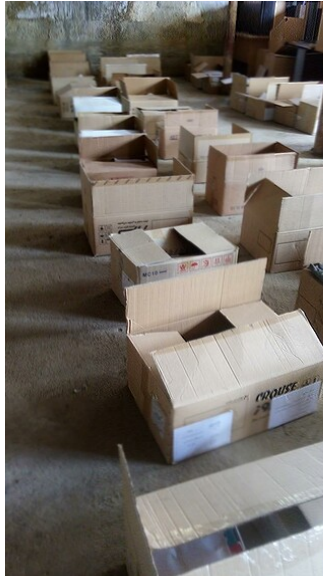
▼ بسته‌بندی کتابها برای هر آموزگار