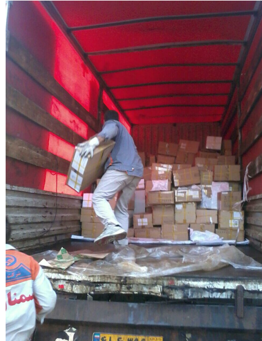
▼ فرستادن کتابها به محل کارگاهها